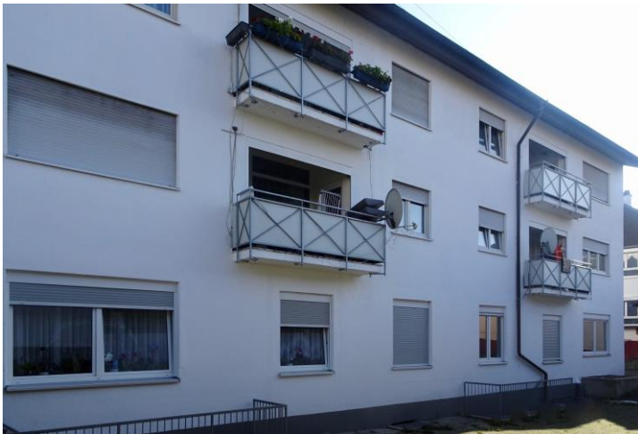
Hausansicht zur Hofseite

Besichtigung: Eine Besichtigung ist nach Absprache mit unserem Büro gerne möglich. Bitte rufen Sie uns an.