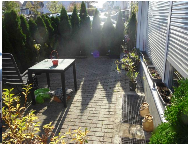
Terrasse zur Friedrichstraße